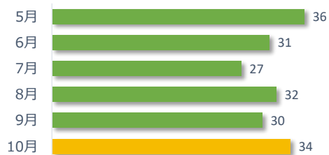
院内調査結果報告件数の推移（直近 6 か月）